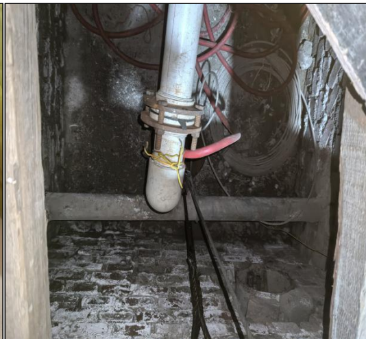
照片 2-4 地热井井口