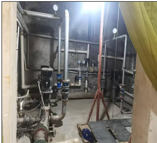
照片 2-3 地热井泵房